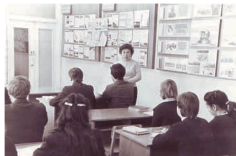
Урок истории в школе № 12. 1970-е годы.