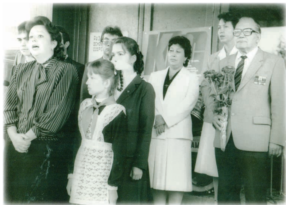
Торжественная линейка в День знаний. 1980-е годы.